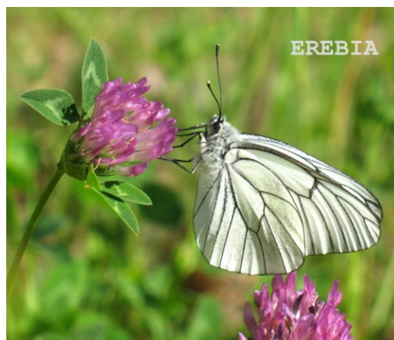
Blanca del majuelo ( Aporia crataegi )

Con respecto a la flora destacamos las orquídeas. En el mes de Abril determinamos cinco especies en un pequeño recorrido por Covas, y en esta ocasión dos, Orchis provincialis y Orchis purpurea .