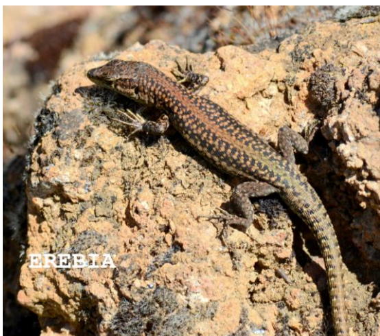
Lagartija ibérica ( Podarcis hispanica ) en el talud

El viento y las temperaturas suaves, a veces frescas, complicaron la observación de reptiles, sólo pudimos observar varias lagartijas ibéricas ( Podarcis hispanica ), en un talud de piedra. Lo mismo sucedió con los lepidópteros, ya que estaban poco activos, aunque al día siguiente eran numerosas las blancas del majuelo ( Aporia crataegi ) que volaban en los prados.